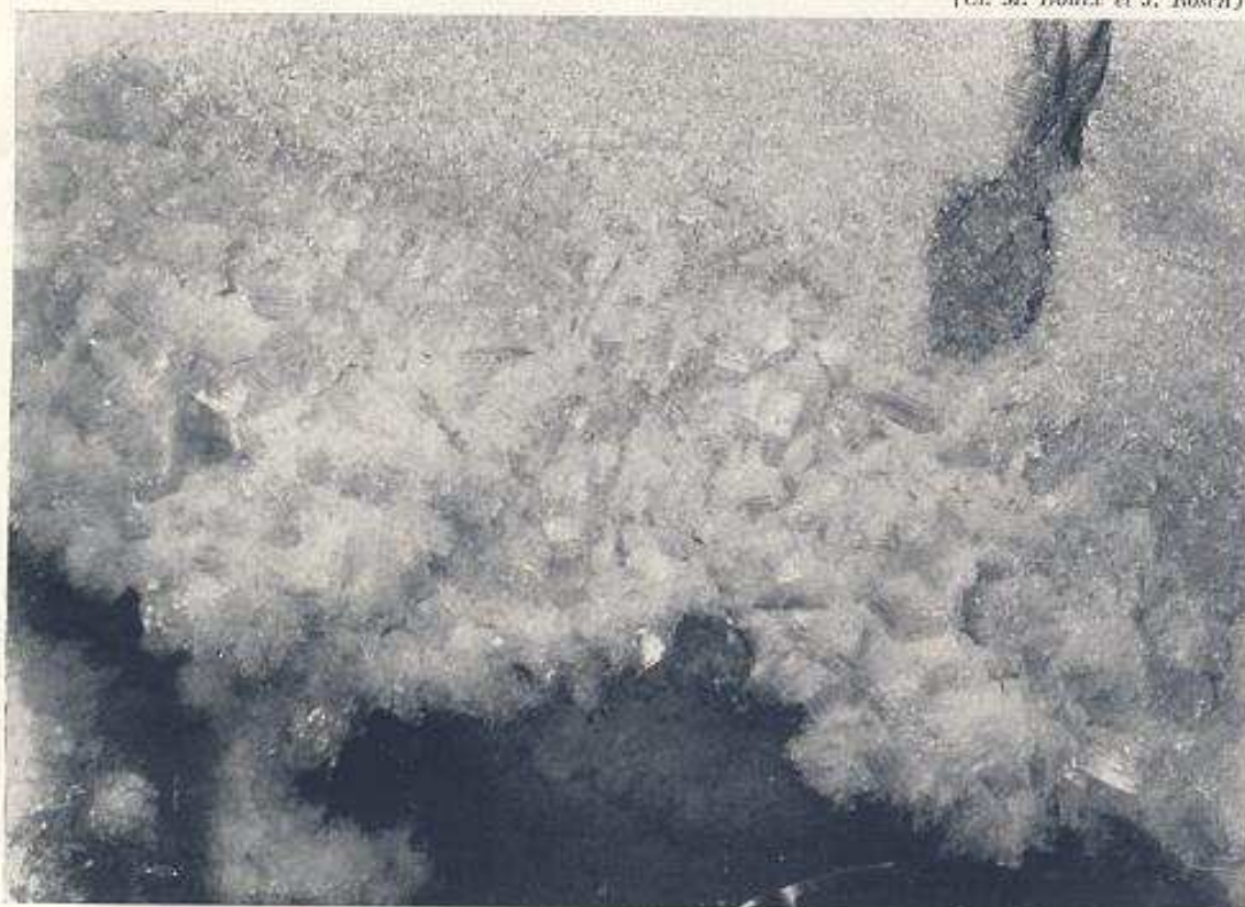
Evolution des cristaux de glace sur le plafond de la salle D.

grêle qui est tombée. Nous atteignons la grotte sans difficultés.