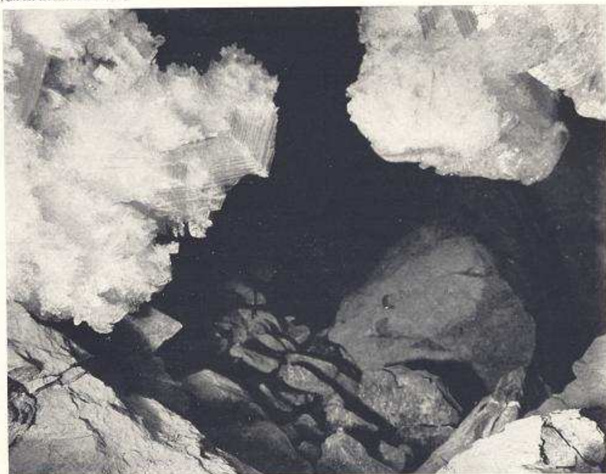
Beaux cristaux de glace à l'entrée de la salle D.

Nous regagnons le camp en faisant une originale ascension à l'Epaule par le névé de la face Nord, cette année tout en glace. Taille fatigante. A 17 h., nous déjeunons. Le lendemain, nous gagnons la Brèche de Roland, et, de là, descendons à Gavarnie sous un copieux orage de grêle. G. R.