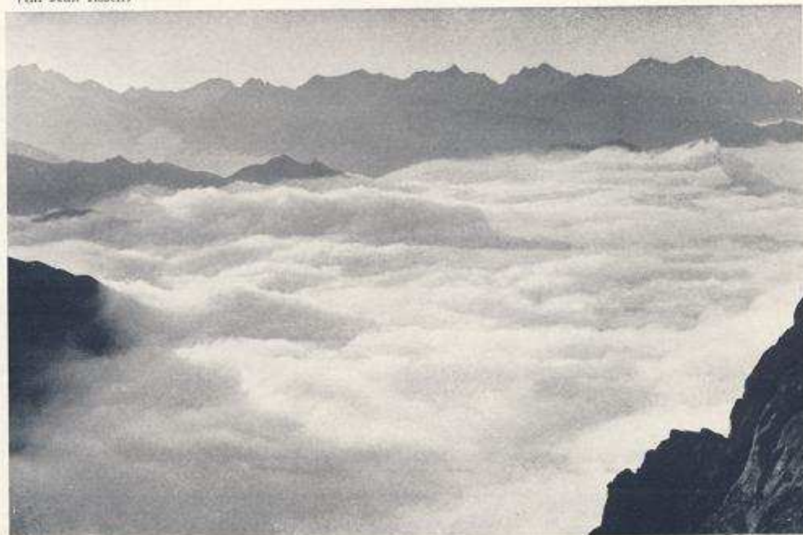
Vue prise de l'entrée de la grotte Devaux.